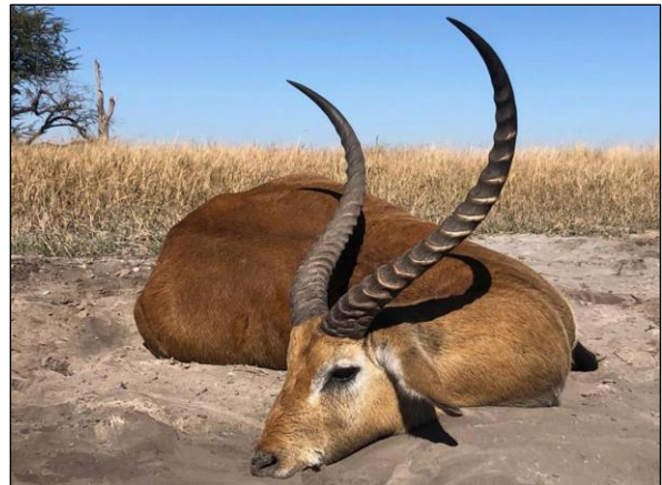
„Lechwe – Moorantilope, rare Beute!“