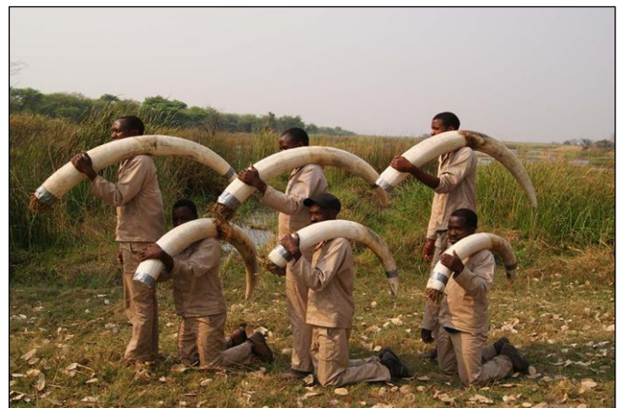
„Erfolgreiche Jagdsaison auf Elefanten geht zu Ende!“