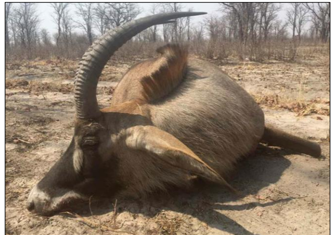
„Wasserbock und Roan (Pferdeantilope) sind charakteristische Wildarten in Dzoti!“