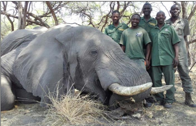
„Das ganze Team freut sich über den Erfolg!“

Weitere Trophäenabschüsse nach aktueller Preisliste. Angeschweißtes Wild, dass trotz intensiver Nachsuche nicht aufgefunden werden kann, gilt als erlegt!