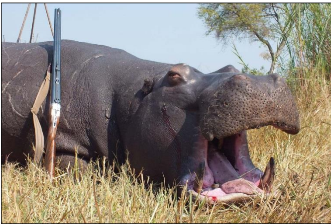
„Spannende Pirsch auf kapitalen Hippobullen!“