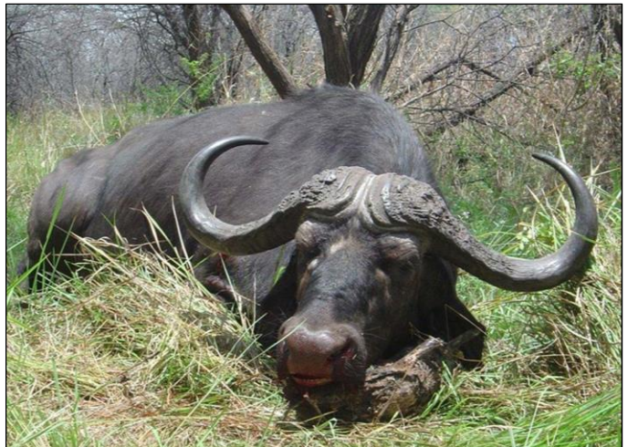
„Die Büffeljagd im Caprivi hat ihren besonderen Reiz!“